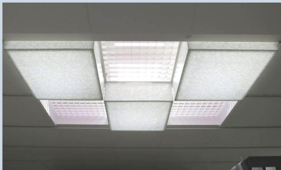
△外国からのお客様が多くいらっしゃるため、日本らしい和紙柄の印刷がされています。春はピンク(桜)、秋は赤(紅葉)など、日本特有のものである四季に合わせた色で照らす照明計画となっています。

成田国際空港(NAA)が建設し2015年4月24日オープンした第2旅客ターミナルビルの本館とサテライトをつなぐ2PTB連絡通路の天井に、行灯型光膜照明が完成しました。昼間は自然採光のみで明るさを確保し、夕方以降はLED照明による光の演出を行います。