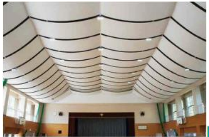
株トニー 本誌 13 頁 膜天井 (懸垂膜工法) Tel 046-271-3222 (1150 膜天井システム)