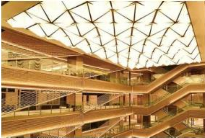
株トニー 本誌 13 頁 膜天井 (パネル工法) Tel 046-271-3222 (1150 膜天井システム)