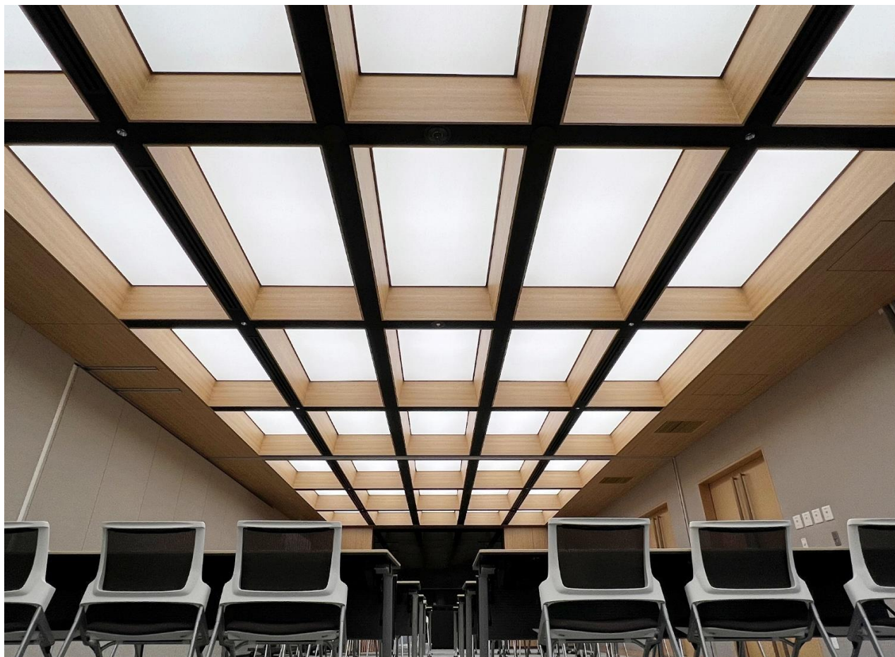
■ 某研修施設 研修室

格子天井の升の中に光膜パネルを入れて光る面をつくることで天井に奥行きを与える効果をもたらしています。